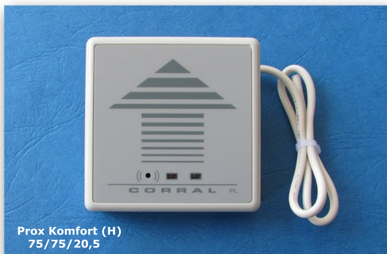
Prox Komfort (H) 75/75/20,5